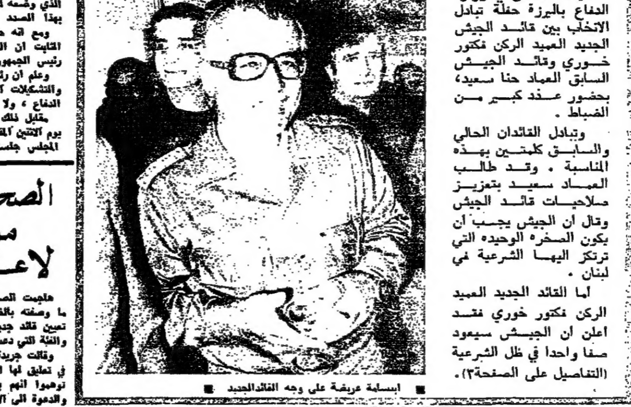
إسماة عريضة على وجه القائد الجديد